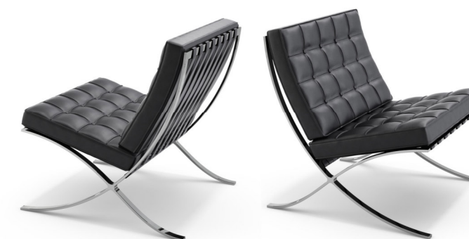
Imagen preguntas 16 y 17

Pregunta 15 Explique las principales características del movimiento y nombre a otros dos artistas de este (1 punto).