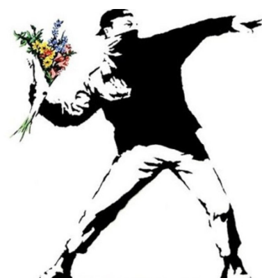
Imagen preguntas 13, 14 y 15

Pregunta 12 Explique las principales características de la obra y el impacto sobre su entorno urbanístico (1 punto).