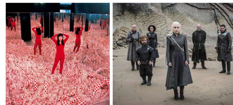
Imagen preguntas 18 y 19

Pregunta 17 Explique las principales aportaciones y relevancia de esta escuela en la historia del diseño (1 punto).