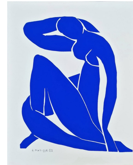
Imagen preguntas 6, 7 y 8