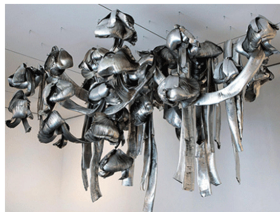
Imagen preguntas 4 y 5