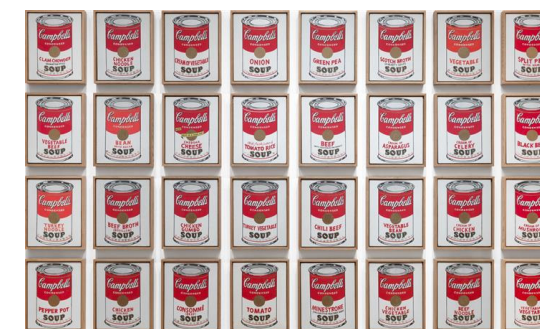
Imagen preguntas 9 y 10