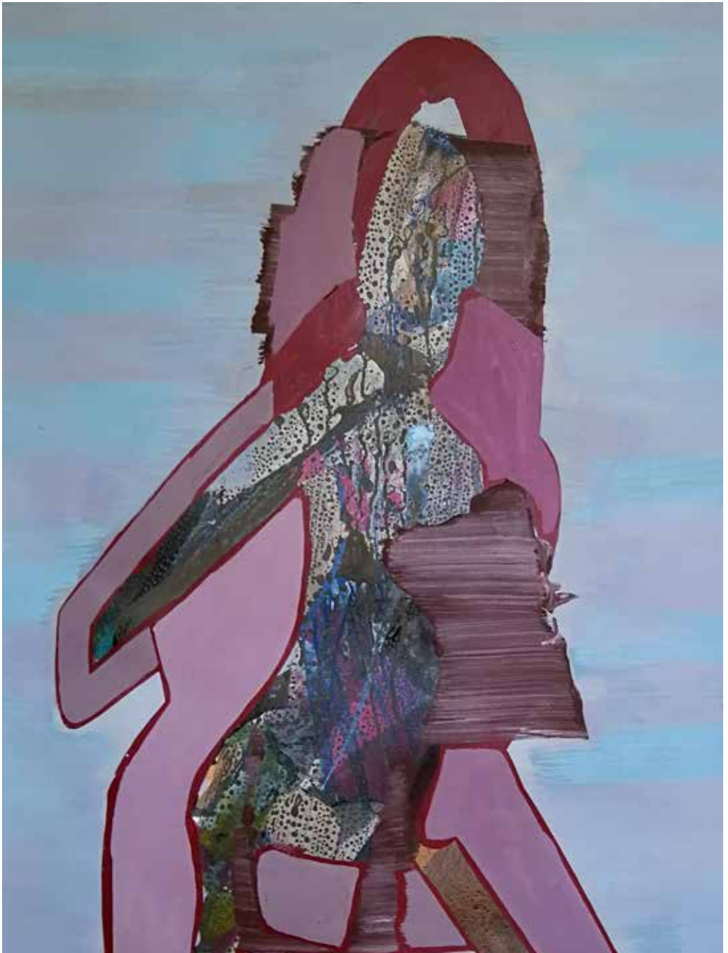
Sombra roja, 2000