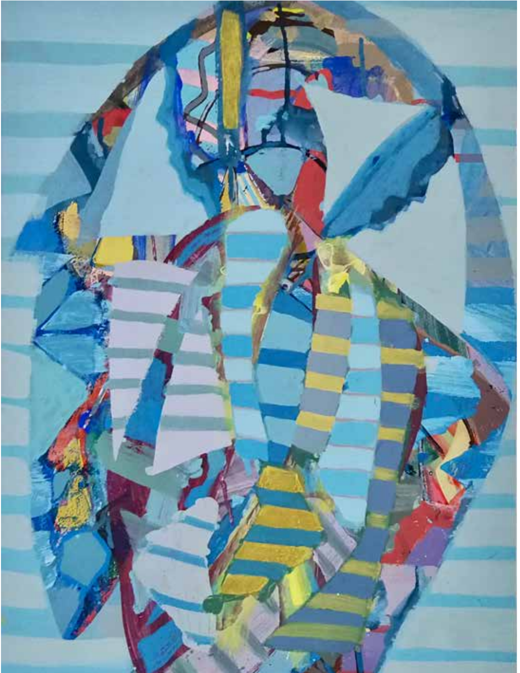
Figura doble, 2020-21