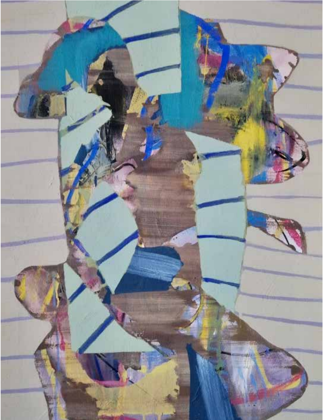
Figura bailando, 2014