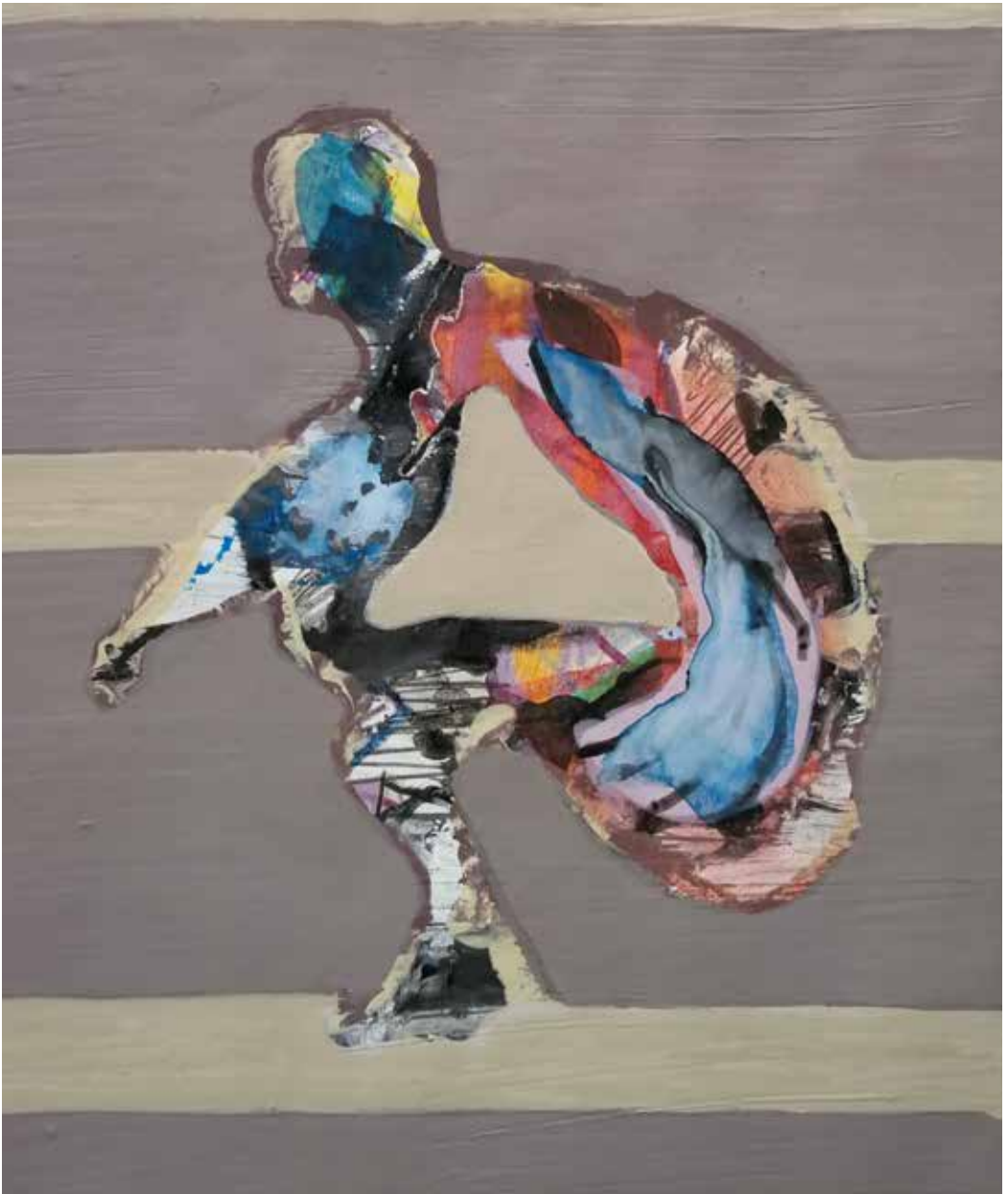
Figura tres, 2017