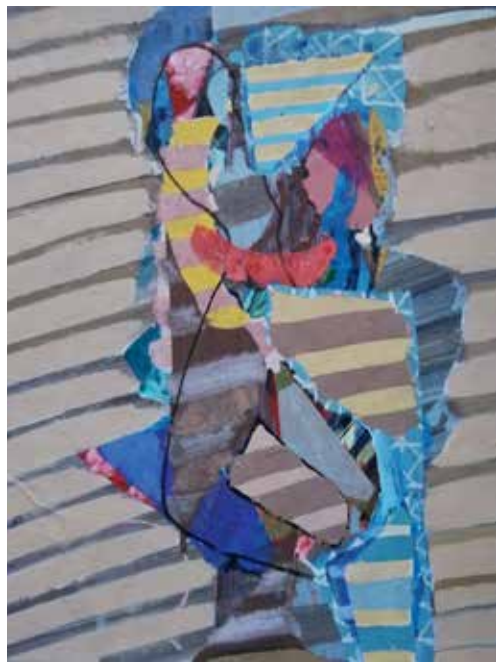
Figure two, 2017