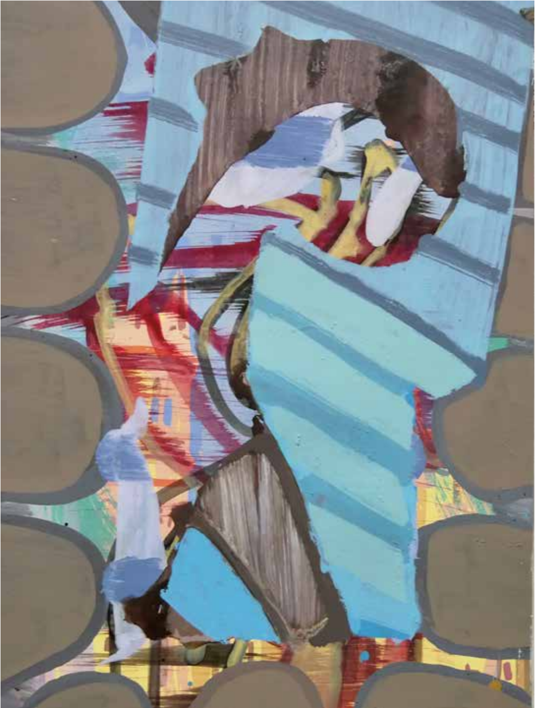
Figura sola, 2017