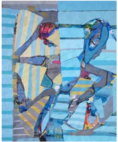
Pareja doble, 2021-22