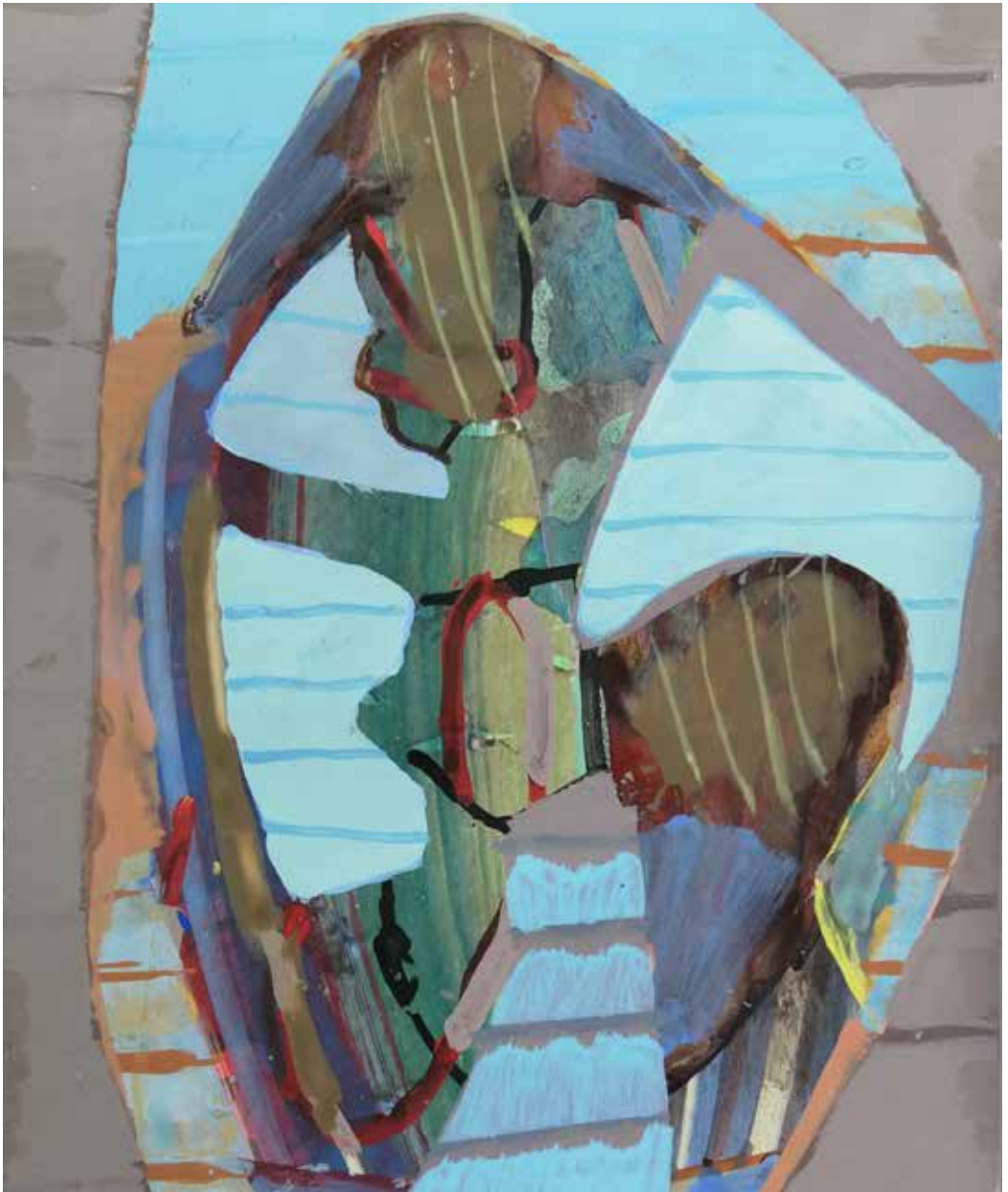
Figura perfil, 2018