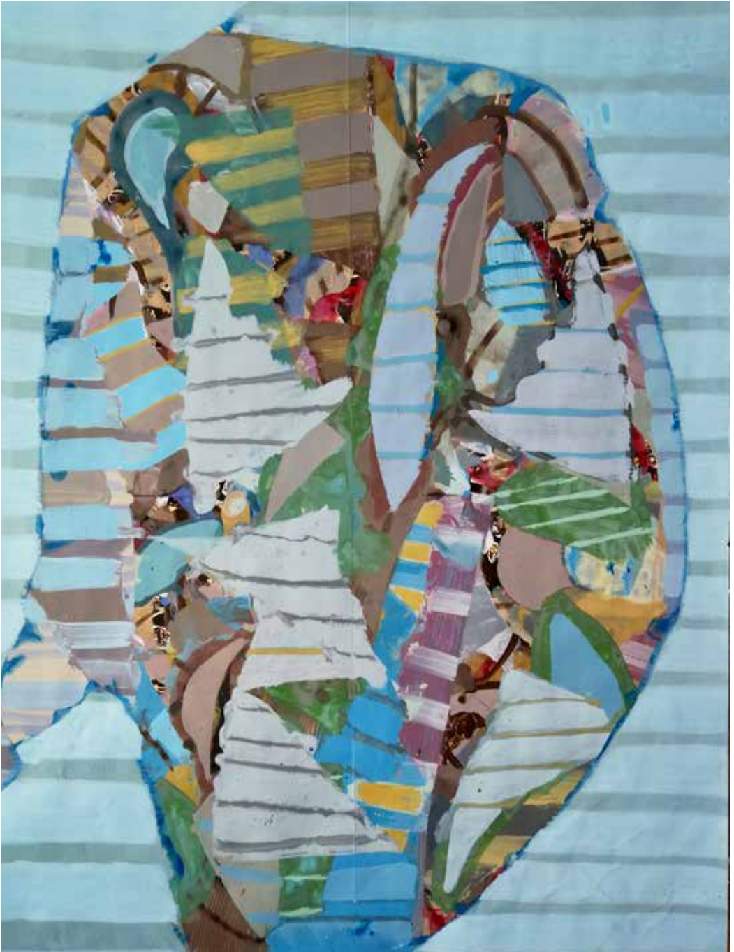
Pareja dos, 2021