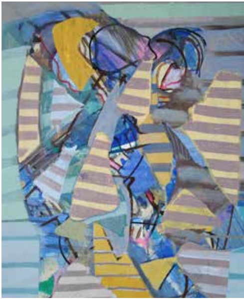
Dos figuras, 2021