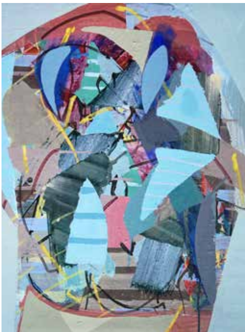
Doble Figura, 2019