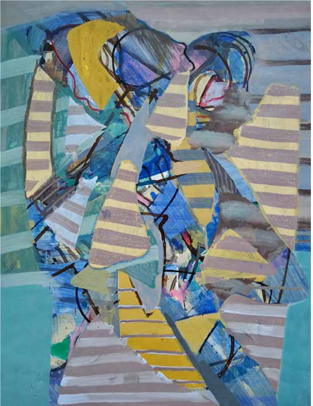
Dos figuras, 2021