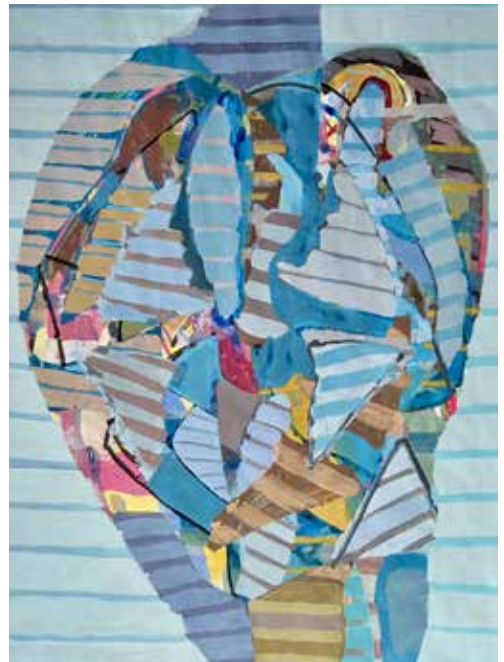
Perfil doble, 2021