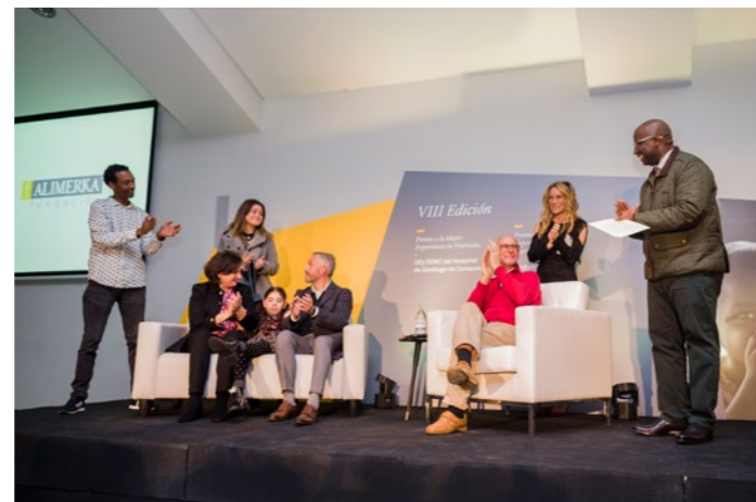
Cierre del acto de entrega de Premios.