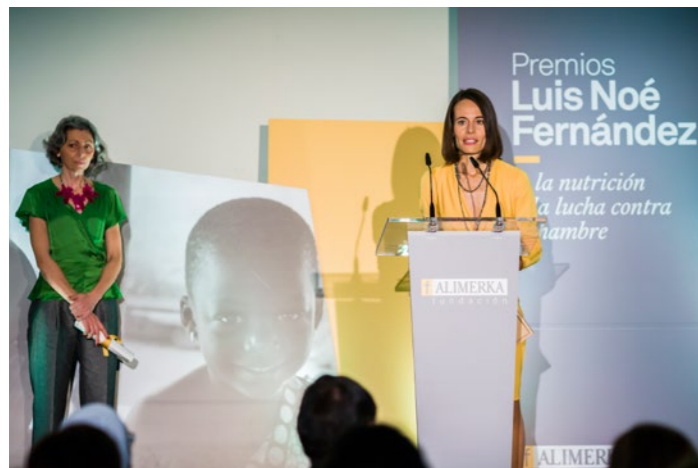
La Unidad de Diagnóstico y Tratamiento de Enfermedades Metabólicas Congénitas del Hospital de Santiago de Compostela, premiada en la categoría de Nutrición en 2017.