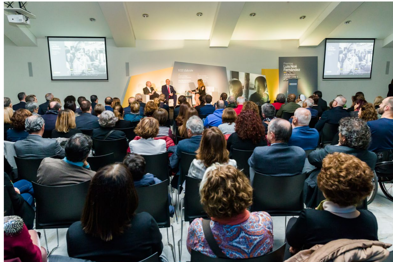
PYFANO y Prosalus, premiados en anteriores ediciones, fueron recordados durante el acto de 2017.