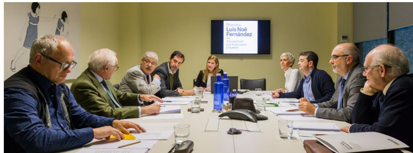
Reunión del Jurado de Lucha contra el Hambre en 2017.