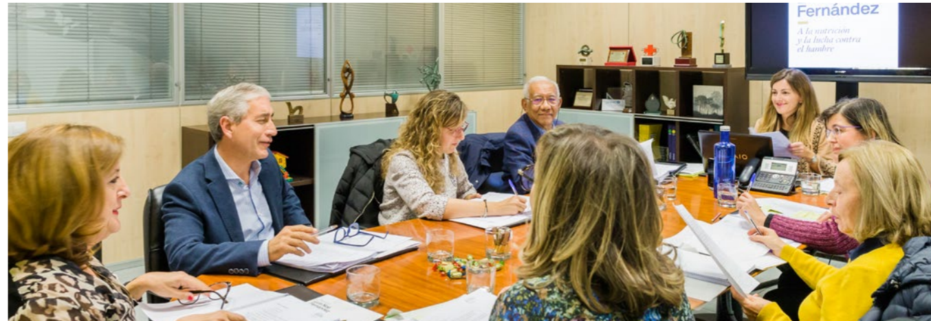
Reunión del Jurado de Nutrición en 2017.