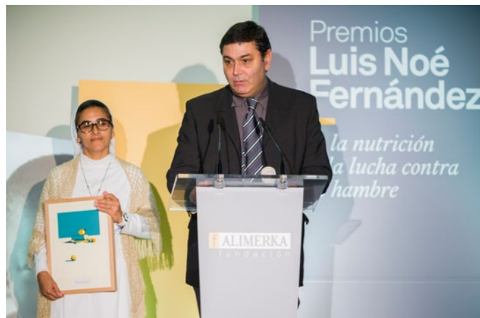
La ONGD Medicus Mundi Asturias, premiada en la categoría de Lucha contra el Hambre en 2017.