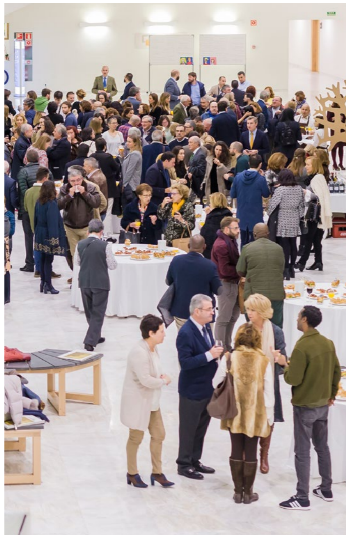
Acto de entrega de Premios, 2017

• Fundación Alimerka se exime de responsabilidad sobre cualquier uso que pueda hacer un tercero de las Imágenes sin su consentimiento o fuera del ámbito territorial, material y temporal del presente acuerdo.