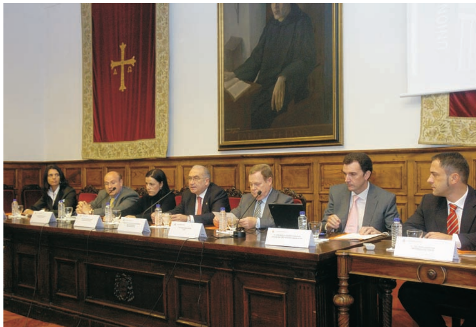
Presidente de DIRCOM España, Presidente de FADE, Rector de la Universidad, Directora de La Nueva España y Directores del Máster

ASICOM - Asociación Iberoamericana de la Comunicación